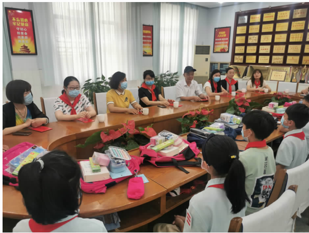
5月29日，魏都区总工会深入古槐街小学开展庆“六一”关爱慰问活动

救助城镇特困职工4人，帮助3名在档困难职工实现了微心愿；在2019年建成10家的基础上，2020年新建6家“户外劳动者驿站”。同时，积极做好关爱女职工工作，为10位困难母亲和11名困难女职工子女及单亲困难女职工子女送去1.55万元慰问金；续签女职工专项集体合同50余家，推进职工婚恋交友平台，新增会员107人，脱单成功61人；并举办多期健康知识讲座。