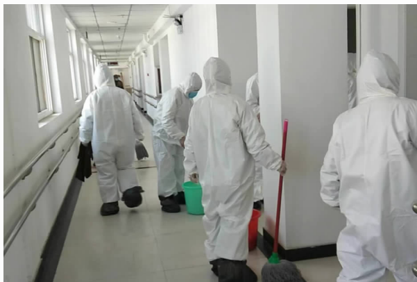
3 月 5 日，保洁人员对隔离中心进行日常清洁消杀

高标准，对机关综合楼保洁消杀人员共开展防疫知识技能培训 5 次，对综合楼内公共区域及隔离中心进行清理消毒每天不少于 4 次。