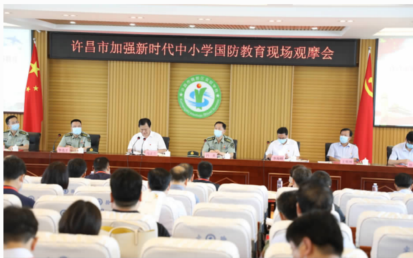
许昌市中小学国防教育现场观摩会在魏都区实验学校召开

【征兵工作】 应对疫情影响，指导各院校武装部及时将国防教育、征兵宣传等内容纳入网课教学计划，专题录制了“魏都区征兵宣传片”，确保在校大学生及时了解掌握征兵工作时间节点、优待优惠政策、上级最新指示精神等，在许昌职业技术学院组织预定兵大学毕业生开展红色教育活动。