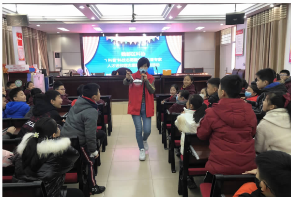
12月9日，科普志愿者在健康路小学为学生演示科学实验秀

【科普志愿服务活动丰富多彩】 大力推进科技志愿服务制度化、规范化、常态化，组织区属科普教育基地结合自身工作领域特点，成立8支“i科普科技志愿服务队”，注册科技志愿者150余名，将医疗、教育、科技、文化等领域的科普宣教人才纳入到队伍中来。