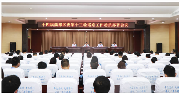
魏都区召开十四届区委第十三轮巡察工作 动员部署会

个维护”作为根本任务，从“四个落实”入手，以区委重点工作部署为中心，突出被巡察党组织职责使命和核心职能，突出党委（党组）领导班子，突出关键少数，聚焦党的路线方针政策和中央重大决策部署、习近平总书记重要讲话和指示批示精神情况，聚焦群众身边腐败和不正之风情况，聚焦党组织领导班子和干部队伍建设情况，并将落实巡视巡察、审计、主题教育等整改情况、落实“以案促改”开展情况、将省委巡视提出的存在问题整改情况纳入重点监督内容，全力查找政治偏差和违规违纪问题。在疫情防控常态化条件下统筹推进全区巡察工作高质量发展，促进区委工作部署落地见效，为加快建设“智造之都、宜居之城”提供坚强保障。