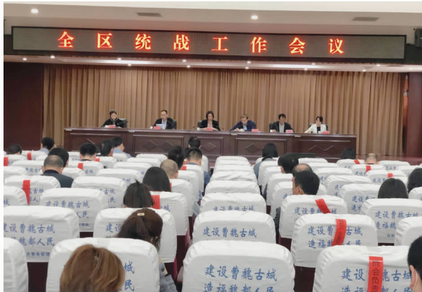
5月11日，魏都区召开全区统战工作会议

【概况】 2020年是全面建成小康社会和“十三五”规划的收官之年，也是决胜脱贫攻坚之年，做好今年的统战工作意义重大。全区统一战线工作总体思路是：以习近平新时代中国特色社会主义思想为指导，全面落实党的十九大和十九届二中、三中、四中全会精神，深入学习贯彻习近平总书记关于加强和改进统一战线工作的重要思想和视察河南重要讲话精神，紧密结合区委区政府中心工作，强化三个围绕，聚焦三篇文章，提升六大关系，在统战工作实体化、社会化、项目化、基层化上狠下功夫，努力在围绕中心、服务大局中展现新作为、作出新贡献，着力开创全区统战工作新局面，为魏都高质量发展凝聚统战力量。