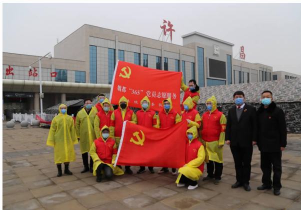
2月26日，魏都区法院干警到火车站参与新冠肺炎疫情防控志愿服务活动

【诉源治理】 落实“两个一站式”建设工作要求，高标准打造多元解纷中心，完善金融一体化对接中心，成立调解委员会，与许昌市保险行业协会、物业协会、房地产协会等10余家行业协会组织对接，参与诉前调解；建立法官联系人制度，实现法官身份和联系信息全上墙，26名分包法官与19名专职人民调解员一起，联合入驻13个街道87个社区，定期通报万人成讼率，服务覆盖五大产业园区，重视涉企纠纷诉前化解，全年诉前调解成功纠纷1920起，成功率43.3%，确保案件化解在基层；畅通诉求表达渠道，员额法官带案走访，常态化征求意见，张贴满意度调查二维码，广泛征集人民群众对法院工作的意见建议，征集到意见建议210余条，主管院长及时回复并安排落实，加强了人民法院与群众联系的紧密度。