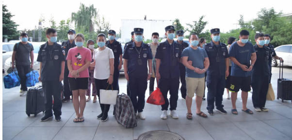
7月，许昌东站，民警和犯罪嫌疑人，异地 抓捕押送回许

社会治安大局持续保持平稳。一是严厉打击严重暴力犯罪。以“云剑-2020”命案积案攻坚专项行动为契机，进一步强化快速反应、合成作战机制。2020年，辖区现行命案发1破1，快速处置一起持刀劫持人质案，成功侦破命案积案2起。二是决战决胜扫黑除恶收官战。以“六清”行动为抓手，严格落实线索核查、专案攻坚等工作机制，确保打深打透、除恶务尽。2020年，侦办恶势力犯罪团伙1个5人，公诉恶势力集团3个12人、恶势力团伙1个4人，查封涉案房产4处。三是重拳打击多发性侵财犯罪。深入研究辖区发案规律，紧盯区域性、团伙性、系列性犯罪，强化措施，努力在增破案、压发案上取得新突破。2020年立传统盗抢骗案件2092起；破获传统盗抢骗案件1661起。四是强力推进“昆仑-2020”专项行动。围绕食品、药品、环境、知识产权等事关民生的重点领域，聚焦群众反映强烈的突出问题，广辟线索来源，开展专项打击，打击黑加油站成绩战果在全市名列前茅。五是全面深化打击经济犯罪。以传销、非法集资、地下钱庄等突出犯罪为打击重点，汇聚优势资源，提升打击效能，护航辖区经济社会健康发展。2020年，破获经济犯罪案件16起，抓获犯罪嫌疑人57人，挽回经济损失1.8亿元。六是全力打赢禁毒人民战争。以禁毒“两打两控”专项行动为牵引，坚持“破大案，抓毒枭，查毒资，断通道”，坚决遏制毒品违法犯罪在魏都区滋生蔓延。2020年，破获毒品案件11起，抓获犯罪嫌疑人21人，强制隔离戒毒37人，缴获