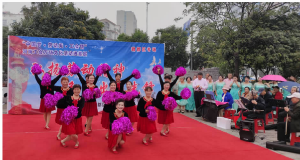
10月13日，在文峰广场开展“中国梦·劳动美·工会情”文化下基层系列宣传活动

【思想建设】 强化政治引领，推进思想建设。2020年，举办了工会系统学习党的十九届五中全会精神报告会。在广场、社区、企业中，开展了85场“中国梦·劳动美·工会情”文化下基层系列宣传活动。在《许昌日报》连续10期开设首届“魏都工匠”专栏。组织了首届“魏都区文明职工”评选表彰活动，对30名同志进行了表彰。新建区级职工书屋10家、推荐省级职工书屋1家、市级职工书屋3家。举办了魏都区职工篮球、羽毛球、乒乓球比赛。