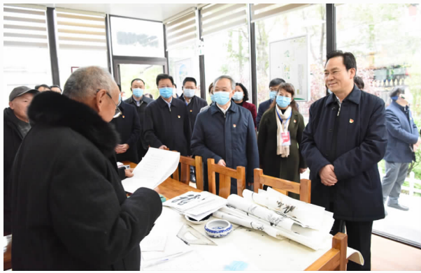
11月27日，省委常委、组织部部长孔昌生到东大街道春秋社区文会警苑小区进行观摩

程，大力推进“创五好、强双基”示范行动，实现基层党组织全面进步、全面过硬，努力争创“全国先进基层党组织”。努力构建区、街道、社区、网格四级党组织为“主轴”的党建引领社会治理体系。坚持把创新作为推动党建工作的强劲动力，重点抓好信息化、网格化、规范化、数字化、特色化“五化”建设。按照“一党委一品牌，一支部一特色”思路，以项目化运作和品牌化创建为途径，引导各级党组织开展各具特色的党建活动，基层首创精神得到释放，特色品牌异彩纷呈，2020年，已列入区级特色品牌20个，党（工）委特色品牌45个。11月27日，全省城市基层党建暨非公经济组织和社会组织党建工作座谈会在许昌召开，省委常委、组织部部长孔昌生带领各地市组织部门到魏都区五一路街道办事处、西关街道许烟社区、东大街道春秋社区文会警苑小区、三鼎集团党群服务中心进行实地观摩，对魏都区城市基层党建、非公经济组织和社会组织党建工作给予了高度评价。