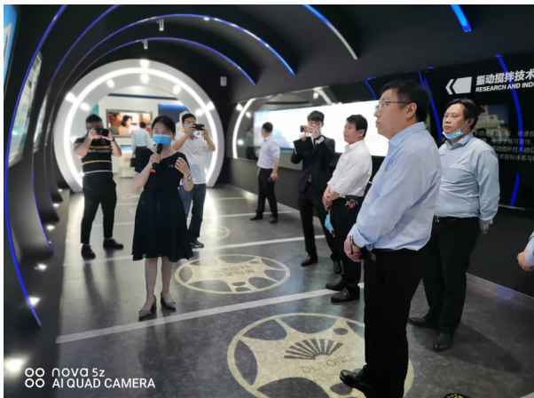
5月19日，组织华为河南政企业务部专家到魏都区考察对接项目

【“互联网+监管”工作】 开展“互联网+监管”平台建设，推动监管数据汇聚。积极组织区直各相关单位梳理认领监管事项，2020 年，全区