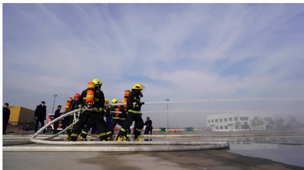
12月25日，魏都区大队开展第四季度比武车操项目训练

效。一是加强学习，不断增强班子的向心力。大队党委充分发挥核心领导、战斗堡垒和先锋模范作用，始终把建设学习型班子作为班子建设的一项政治任务和经常性、基础性工作来抓，坚持用党的先进理论武装头脑，不断提高班子的整体素质和能力。二是落实制度，不断增强班子的凝聚力。大队党委始终坚持民主集中制原则，定期召开民主生活会，建立科学民主的决策机制。班子成员自觉加强党性修养，召开会议研究事项，坚持做到少数服从多数，每名成员的政治权利得到充分尊重与发挥。对涉及诸如重大经费开支、入党考学、评优评先事关队伍建设及指战员切身利益的事，一律由党委会集体研究决定，杜绝了