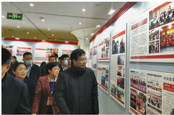
12月5日，中宣部副部长傅华观看魏都区“糖豆妈妈讲故事”志愿服务项目展示

15名专家教授为顾问的技术支撑团队。通过“许昌英才计划”一事一议的优惠政策，获得市政府奖励津贴3000万元；在第二届中原人才发展环境高峰论坛上，新引进的5个重点项目团队和2名高层次人才成功签约。优化人才发展环境，依托“魏都大讲堂”“月训讲坛”“魏都云课堂”等平台，加强对人才的政治引领和政治吸纳；经常走访慰问专家人才，加强党内激励和关爱；落实拔尖人才体检、津贴等政策待遇，增强人才的荣誉感和归属感；设置高层次人才服务窗口，提供一站式服务新体验。采取线下和线上相结合的活动形式，持续开展专家人才志愿服务活动。2020年，组织开展专家人才志愿服务活动98次，直接服务群众20000余人，“糖豆妈妈讲故事”“科普专家进校园”“教育名师大讲堂”等魏都品牌擦得更亮。中宣部召开全国新时代文明实践志愿服务培训，“糖豆妈妈讲故事”成为全市唯一入选的志愿服务项目。大国人才网、党的生活网、豫青网等国家级、省级媒体先后报道魏都区人才工作经验做法，魏都区专家人才服务优秀摄影作品《民情口袋本——社区人才寇苴平的责任与担当》被大国人才公众号选登，《非物质文化遗产传统糖画制作传承人——俎文彦》在“人才助力全面小康——2020年（第六届）全国人才工作新闻摄影暨短视频比赛”中获得三等奖。