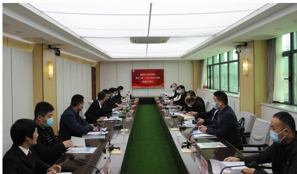
10月22日上午，魏都区检察院与魏都区工商联联合举办了“服务‘六稳’‘六保’护航民企发展”检察开放日活动

企监督案件、控告申诉案件 54 件逐案进行问题自查，制定整改措施。与区工商联加强沟通联系，出台服务保障民营经济六项制度。成立 6 支服务小队，深入企业走访，为解决企业的痛点难点提供法治保障。