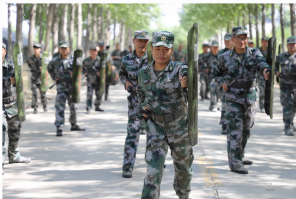
轮训备勤基干民兵训练

【概况】 2020年，魏都区人武部深入学习贯彻习近平新时代中国特色社会主义思想 and 强军思想重要指示精神，深入贯彻落实上级党委（扩大）会议精神，在抓好疫情防控的前提下认真抓好各项工作落实，人武部全面建设保持了稳中求进、稳步发展的良好态势。