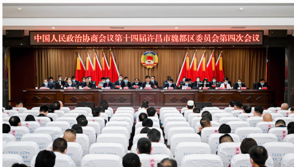
政协第十四届许昌市魏都区委员会第四次会议

2020年是全面建成小康社会和“十三五”规划圆满收官之年。区政协常委会坚持以习近平新时代中国特色社会主义思想为指导，全面贯彻党的十九大和十九届二中、三中、四中全会精神，深入学习贯彻习近平总书记关于加强和改进人民政协工作的重要思想，锚定新时代人民政协的新方位新使命，全面贯彻中共中央大政方针和省、市、区委决策部署，立足魏都发展的新形势新任务，充分发挥专门协商机构作用，坚决维护核心、倾力服务大局、真情服务群众，统筹推进疫情防控和经济社会发展“双胜利”，为推动魏都区高质量发展、在建设“智造之都、宜居之城”中持续走在前列作出了积极贡献。