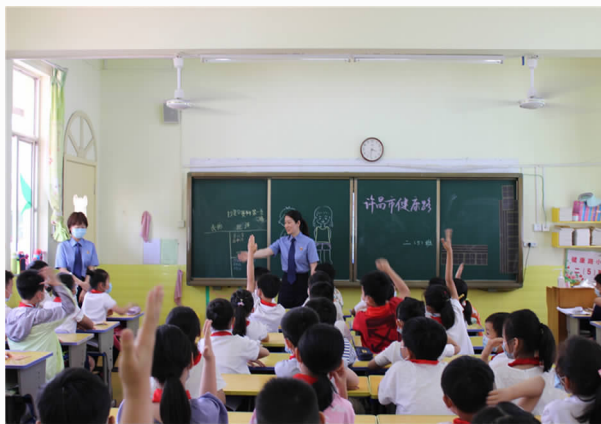
5月27日，到健康路小学开展“法治进校园”巡讲活动

件，办理一起濒危野生动物刑事附带民事公益诉讼案件，追偿公益损失 3 万元。配合全省农村乱占耕地建房问题整治工作，向有关部门发出检察建议 7 件，均已整改。排查生态环境领域公益诉讼案件线索 21 件，发出诉前检察建议 14 件，均已整改。落实“河长+检察长”工作意见，建立信息共享、联席会议等机制，排查水污染线索 8 件，立案 4 件，发出诉前检察建议 2 件，清除河道周边垃圾 2200 方。推进“公益诉讼守护美好生活”专项监督活动，发出油烟噪音污染问题类检察建议 12 件，行政部门的整改成效得到群众认可。落实“一号检察建议”，严厉打击侵害未成年人犯罪，批准逮捕 24 人，提起公诉 34 人。不批准逮捕未成年犯罪嫌疑人 17 人，不起诉 5 人，附条件不起诉 15 人，办理了全市首例撤销监护权案件，在许昌市妇幼保健院设立未成年被害人“一站式”询问区，与许昌市润荷社会服务中心联合开展“一体化”保护模式，对未成年人心理辅导 60 余人次，与区教体局联合主办“法治进校园”巡讲 40 余场，受教育师生 3 万余人，完成法治副校长全覆盖。