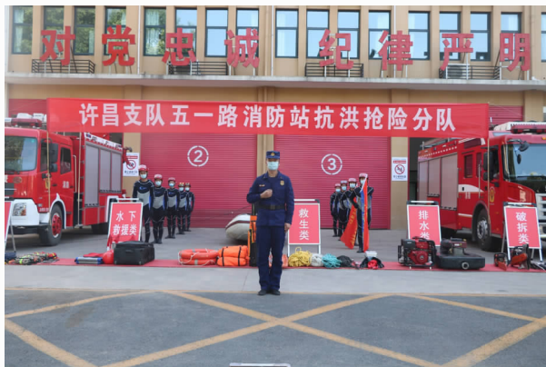
5月18日，魏都区大队参加抗洪抢险拉动演练工作

【火灾形势及灭火救援情况】 2020年，大队共开展“六熟悉”177次，熟悉重点单位131家，开展灭火演练177次，修订预案131份，突出了实战练兵的针对性和实用性，真正达到了增强队伍战斗力的目的。2020年，大队共接处警1202起，其中火灾扑救434起，抢险救援260起，社会救助445起，其他出动63起，出动车辆2501辆，出动警力14878人次，共抢救被困人员22人，疏散被困人员450人，抢救财产价值6135.13万元。全年未发生较大以上有影响火灾事故。