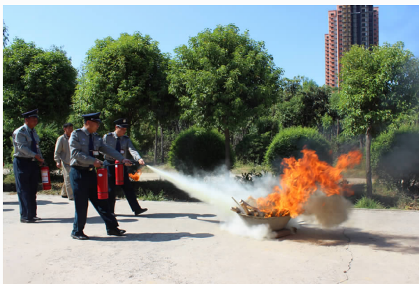
4月28日，安保人员在西停车场进行消防演练

【机关党建阵地建设】 区事务中心党组坚持把双服务（服务中心工作，服务机关党建）作为中心工作重点。全力推进“党建+业务”工作模式，结合事务中心实际进行多次研究探讨，倾力打造魏都区机关事务中心党建文化走廊。整体设置是以展板为主，所有展板编排细致、独具匠心，共计50多块，主要内容包含精神文明建设宣传、党建与业务的融合、党员风采、文明城市等，党建文化走廊的建成在全中心营造了崇尚先进、担当进取、勇创一流的浓厚氛围，是中心党建工作的新窗口、宣传党建知识的新载体、教育党员的新阵地，对于增强党组织凝聚力，引导党员进一步坚定理想信念、提高党性觉悟、争当时代先锋将起到重要作用。为全面落实从严治党工作要求，强化机关党建工作，提升广大党员的党性意识和综合素质，制定了《关于将非机关党员纳入管理的工作方案》，通过机关党员和非机关党员共同参加党建活动，共同参与实际业务，加强沟通交流，强化互相监督，共同全面提升，最终达到推进中心各类业务工作的实际效能。