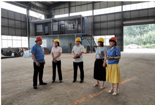
6月11日，带领郑州银行工作人员到天宏钢构开展银企对接活动

【搭建银企对接平台】 为减轻疫情对企业经营的影响，保持经济正常运行，加快企业复工复产，制定了《关于三类地方金融机构复工复产（产）实施方案》《魏都区金融支持疫情防控和经济发展措施》《魏都区金融办关于“应对新型冠状病毒感染的肺炎疫情支持企业健康发展”的落实意见》。组织郑州银行、建设银行、工商银行到德通振动、同庆纺织、爱彼爱和、恩诺格等公司走访，详细介绍“做好金融支持疫情防控和支撑企业健康发展若干政策和措施”，宣讲金融政策、金融产品，帮助企业共同渡过难关。按照省市探索建立主办银行制度工作实施方案要求，