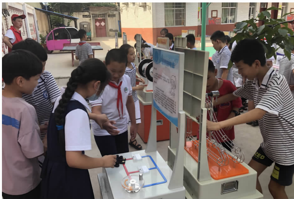
7月6日，董庄小学学生在体验科普大篷车上的科普展品

精心组织全国科普日活动。9月19日，组织腾飞建材、万里交科等科技企业和区属科普教育基地，通过多媒体展示、科技工作者讲解等多种形式，向居民群众普及科技创新成果和科普教育成果。区科协现场参与活动的群众发放科普宣传笔、科普纸抽、科普手提袋等宣传物品、资料1000余份，进一步提升居民群众参与科普、学习科学的兴趣和积极性。区宣传、科技、农业、卫生等部门单位和区属科普教育基地、科普示范社区、科技特色示范校等地作为活动分会场，以