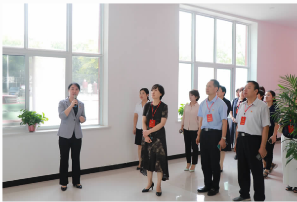
政协委员看发展看变化

【扩大对外宣传】 2020年，魏都区政协将微信平台作为宣传和展现政协履职工作的窗口，“魏都政协”公众号推送36期119条信息，传递政协声音、展示委员风采。依托区政协书画院，组织政协委员及书画名家开展书画艺术交流活动7次，在文化交流中扩大联谊，宣传魏都。成功举办魏都区政协书画院2020年“魅力三国·美丽