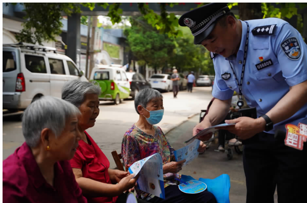
6月，在社区开展反诈骗宣传

【科技信息化建设】 以网安数据资源为依托，坚持把科技强警、创新发展贯穿公安工作始终，进一步加强公安科技信息化建设，服务实战需要。一是加大对信息化建设投入力度。2020年，顺利完成分局互联网升级改造（更换核心交换机1个、加装楼层交换机12个）、网安大队搬迁及专业技术设备购置、新成立派出所信息化建设等一系列重大建设项目，为公安科技信息化建设提供坚实保障。二是稳固加强公安网络安全管理。以“护网2020”网络攻防演习为契机，全面加强公安信息网边界安全防护，对通过边界接入公安信息网的单位及设备进行摸底排查、澄清底数，定期组织开展安全检查，消除隐患、堵塞漏洞，全年未发生公安网技术性失泄密问题。三是加快推进“雪亮工程”建设。按照市局统一部署，按期完成新建1254路视频监控的点位选址、建设招标等工