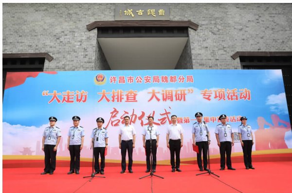
6月，许昌市公安局魏都分局“大走访大排 查大调研”启动仪式

【提升打防综合战力】 2020年6月，新一届分局党委细致部署，全面组织开展“大走访大排查大调研”专项活动，扬成绩、查问题、补短板、强弱项，为更好履行新时代公安机关职责使命奠定坚实基础。一是全警动员，组织领导有力。全面实行党委成员分片包干、战区督导工作机制，坚持“网格化运行、捆绑式作业”，分局机关225名警力全部下沉基层，与56个警务室社区警力共同开展入户、进店、访企工作。活动期间，共投入警力20367人次，实现了警力全参与、区域全覆盖。二是走访排查，起底矛盾隐患。坚持“突出重点、精准施策”原则，按期完成124家国保重点单位、31家易制毒化学品单位、447家治安重点单位及1961名重点人员走访排查任务；同时坚持边走边查、边查边改，全面清除各类矛盾纠纷和风险隐患。活动期间，走访住户74738家165756人、企业单位838家2472人、沿街门店15413家21054人，消除风险隐患744处，解决民生实事125件，化解矛盾纠纷103起。三是打防并重，活