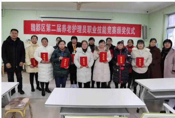
12月11日，在许昌市老年公寓举办魏都区第二届养老护理员职业技能竞赛颁奖仪式

【素质提升】 强化职工素质，推进主力作用。一是组织竞赛：与区民政局联合开展老人护理行业技能竞赛、与区物业协会联合举办物业行业管